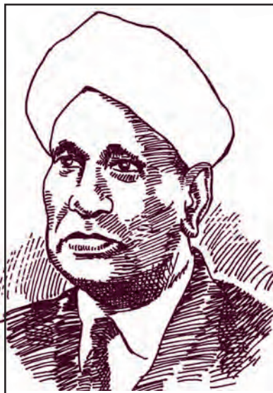
सर चंद्रशेखर वेंकट रामन्

रामन् का मस्तिष्क विज्ञान के रहस्यों को सुलझाने के लिए बचपन से ही बेचैन रहता था। अपने कॉलेज के ज़माने से ही उन्होंने शोधकार्यों में दिलचस्पी लेना शुरू कर दिया था। उनका पहला शोधपत्र फिलॉसॉफिकल मैगजीन में प्रकाशित हुआ था। उनकी दिली इच्छा तो यही थी कि वे अपना सारा जीवन शोधकार्यों को ही समर्पित कर दें, मगर उन दिनों शोधकार्य को पूरे समय के कैरियर के रूप में अपनाने की कोई खास व्यवस्था नहीं थी। प्रतिभावान छात्र सरकारी नौकरी की ओर आकर्षित होते थे। रामन् भी अपने समय के अन्य सुयोग्य छात्रों की भाँति भारत सरकार के वित्त-विभाग में अफ़सर बन गए। उनकी तैनाती कलकत्ता* में हुई।